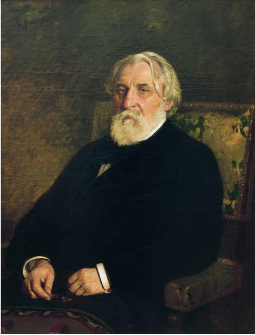
Художник И. Е.Репин