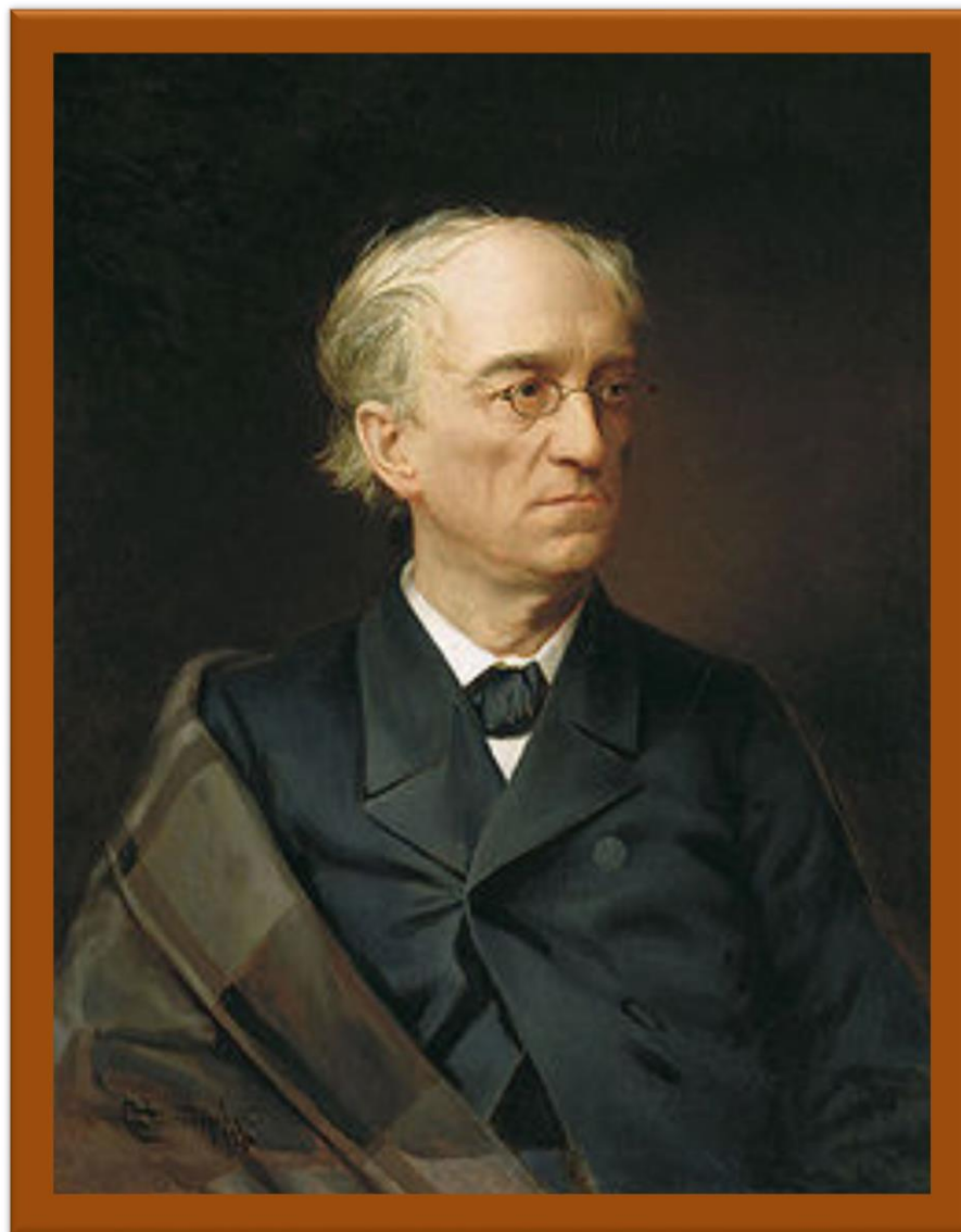
Портрет Ф.И.Тютчева Художник Александровский Степан Федорович Третьяковская галерея